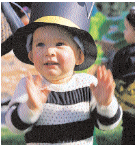
¿Quién será el mago de la chistera?