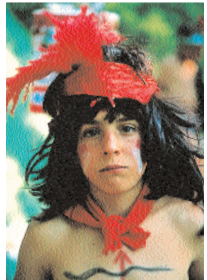
... Y faltaba el indio de las praderas.