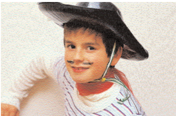
Un sombrero y un bigote hacen un vaquero.