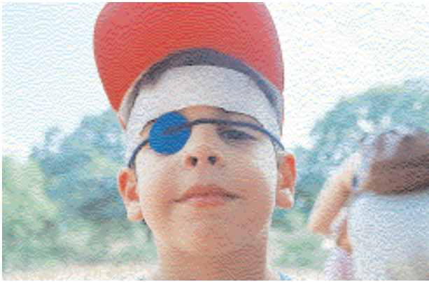
Una gorra, una cinta de papel, un pequeño parche negro con una goma y tenemos un pirata.

A poco que se estimule a los niños, con un trapito de aquí, una cosita de allá, unas cintas, una goma, etc., estarán dispuestos a vivir cualquier aventura fantástica.