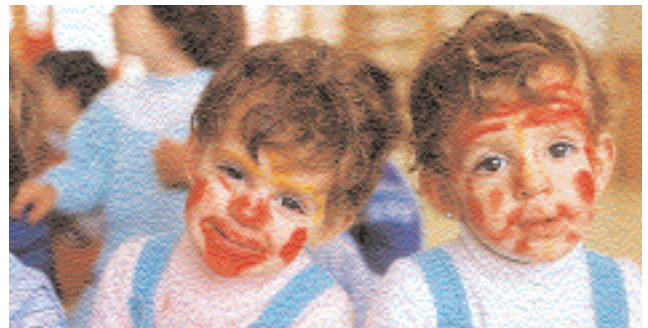
Pintando a los niños con maquillaje en los mofletes pueden parecer unos payasos.